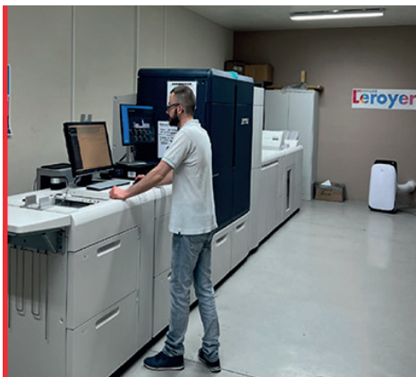
Un opérateur machine de l'imprimerie Leroyer entrain d'exécuter un travail d'impression sur une presse Xerox

L'Iridesse, quant à elle, nous permet de faire des documents de très haute qualité et à fort taux de couverture.