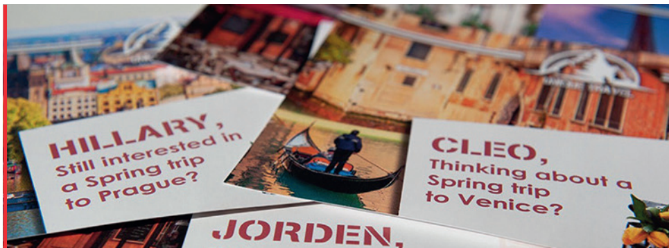
Lancez-vous dans l'envoi de courriers personnalisés

Le module d'alimentation à aspiration grande capacité grand format XLS de Xerox® a été spécifiquement conçu pour générer les bénéfices que vous attendez en accélérant la production sur des supports allant jusqu'à 1,2 mètre de long. Associez-le à une presse puissante et vous pourrez oublier les opérations manuelles fastidieuses et les changements d'équipement, pour bénéficier d'une impression accélérée sur des supports grand format, avec des marges bien plus que respectables.