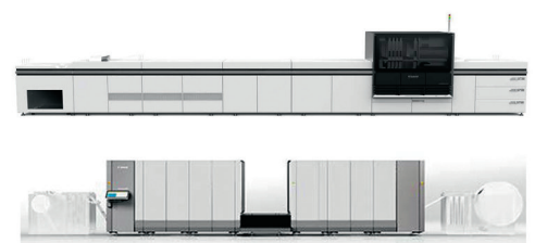
Les innovations Canon...

si que son engagement sans faille pour le secteur de l'impression.